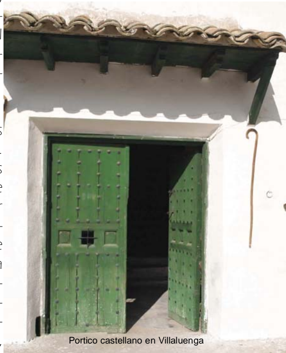
Portico castellano en Villaluenga

paso más y ese paso tiene que venir del esfuerzo colectivo, de la ilusión de un proyecto de todos. Y en esa tarea estamos. El Grupo no pertenece a nadie en concreto, es de todos y para todos, pero el esfuerzo debe ser también de todos, realizado por todos. El esconderse a estas alturas no conduce a nada, más bien a todo lo contrario de lo que se persigue, y además es fácil ver a quien deja la responsabilidad a los demás. Por eso el año 2008 tiene que ser un revulsivo para este grupo que ya es mayor de edad y que no necesita de guías espirituales sino de personas que estén dispuestas a trabajar. En ello estamos y a ello convocamos. Nadie es más que nadie, y además todos somos necesarios.